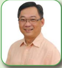
Mr Gan Kim Yong Minister for Trade and Industry MP for Chua Chu Kang GRC