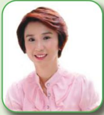
Ms Low Yen Ling Minister of State Ministry of Trade and Industry & Ministry of Culture, Community and Youth Mayor of South West District MP for Chua Chu Kang GRC Chairman of Chua Chu Kang Town Council