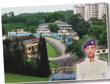
Old Keat Hong Camp

*The following Monday is a public holiday. Public Holiday