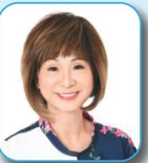
Dr Amy Khor Lean Suan Senior Minister of State Ministry of Sustainability and the Environment & Ministry of Transport MP for Hong Kah North SMC Vice-Chairman of Chua Chu Kang Town Council